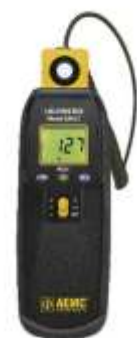
LUXOMETRO DIGITAL 20/200/2000 MARCA PALMER WAHL MODELO CA813 SERIE 1237000365