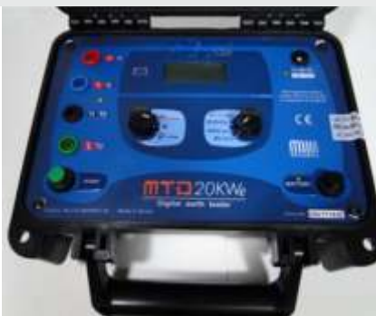
TELUOMETRO DIGITAL SERIE: OI 5120D MODELO: MTD 20 kWe