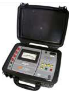
MEGOMETRO SERIE: OI 6160e MODELO: MI 20 Kve