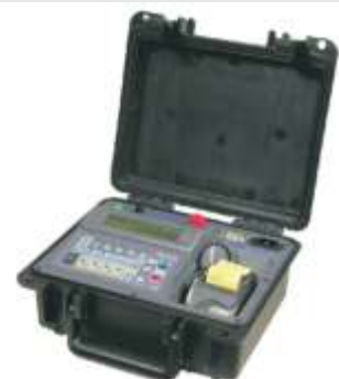
MEGOMETRO DIGITAL MICROPROCESADO SERIE: MO 8083A MODELO MD 5060X