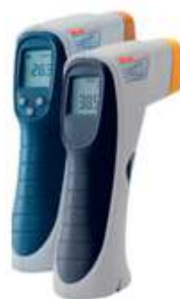
TERMOMETRO INFRARROJO SERIE: 1237000365 MODELO: DHS115XEL