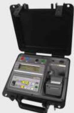
TELUOMETRO DIGITAL MICROPROCESADO SERIE: MO 6333H MODELO EM 4055